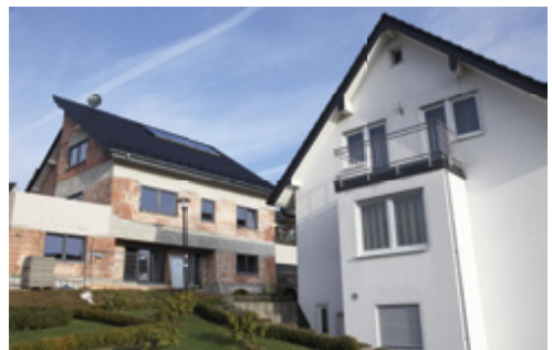
realisierter 1. Bauabschnitt

EGG | ENTWICKLUNGSGESELLSCHAFT GUMMERSBACH MBH Brückenstraße 4 | 51643 Gummersbach